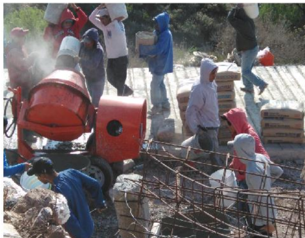
HÄNJA DI MFASTE YÄ NDADA ZIT'OHÖ

Zi t'uki yä hñohö huxä yä fui, sehe nuhu di mpefi ha ra 'batha, 'ra yä jäi huts'i yä mfuhña nuhu xa thoki ko ya dutu. ya hee ma paya, ga'tho yä mengu enä ge yä hogä dutu, nde di jamädi handa ra hyandya'bu ne ma 'raa pa ma 'ra ya hnini bi handi hanja di mponi ya dutu 'ne yä thixfri.