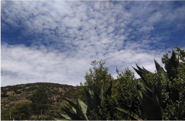
'Ra koi, maa hãnja 'ra pa nuna hnini

Nu yã nguu ja hä ya ua rä t'ohö, 'ne de ri nga'ti ha 'na ra 'batha habu 'nehe tsot'e ra dahñu nge'ã ma hyoni njabu da za da ntai.