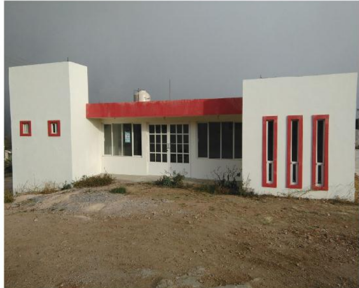
RÄ NGU NT'OTHETE