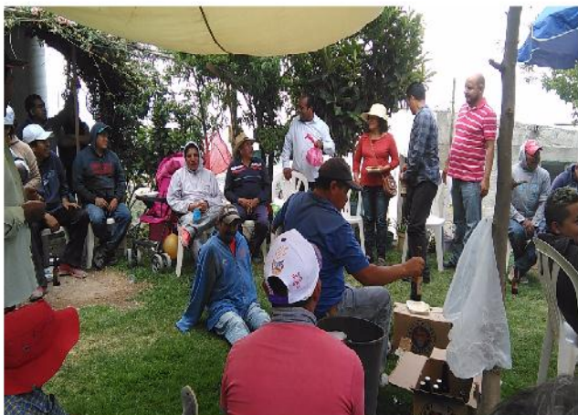
YÄ HEHE YÄ MENGU DI GEHNI

Rä'ya 'befi pe'tsi nuu yä mengu di gehni; räa di 'mpefi de gä gädo pa da hyoki yä nguu; ja yä ñante; ya 'yut'äuenda; yä xahnäte; ra yä 'memapa, 'ra yä ndada hoki yä 'bojä pä dä mpefi ha yä 'batha, ngu: ya juai, yä dajuai, yä t'abi, yä t'egi, yä t'afi, ne'ma rä yä mpepi. Nu yä 'behña o yä nitá di 'bui 'ne di mpefi hä yä nguu, hoka rä hñuni, ne di su yä batsi.