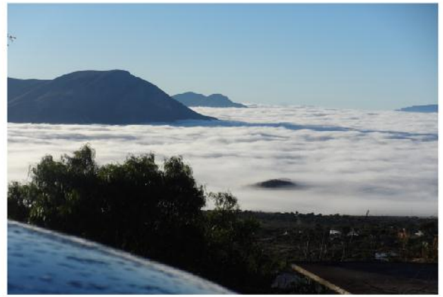
Koi, habu di 'neki xã tse