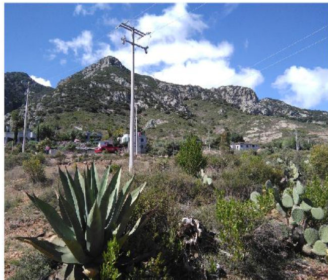
Ha'bu hehe 'ra thuhu, Zit'ohó

Nu nä hemi 'behnä n'tofo mi pe'tsi, hä rä ngu Nda Kandi, rä dada Nda Rafe, hä ngu mä 'nate ne 'reta njeya bi m'edi pe o hä rä mfeni ha hindä pumfri bi ñ'ena