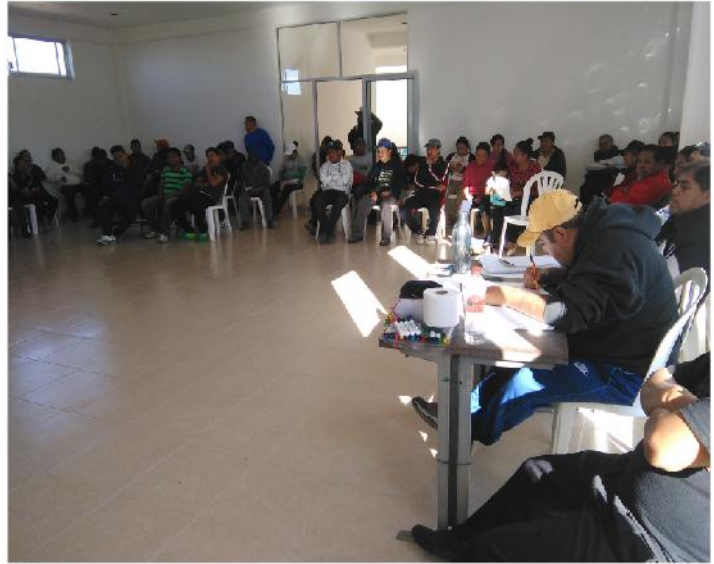
'RA MUNTSI KO YÄ NDADA HÄ 'RA NGU TS' UTUI

Rä njeja 'na 'mo gut'o nthebe ne gut'o 'reta ma yoto bi muti nu na 'yo'ma'ñu hmuntsi ts'u'tui; t'ena ge nu rä 'befi, dä nuu, ne dä hyandi yä kohi xä 'beni ha ra hmutsi, n'ehē njabu dä umbä rä mhati yä ndada, ne yä t'uka ts'u'tui nu'bu hindä mpefi xä ñyo, nehe dä za dä yopä hyoki, ne dä y'ofo mä rä yä kohi, nepu dä hñäts'í ha rä hmunst'í habu dra hma bu da za da gohi ng 'na rä kohi.