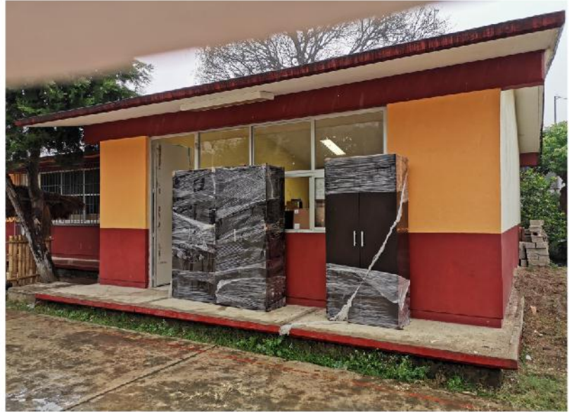
Imagen propiedad del

Tech chia notlamachtijketl Ka miyak pakilistli Uestka nech tlajpaloua tlauel yejkektsi no kaltlamachtilyon.